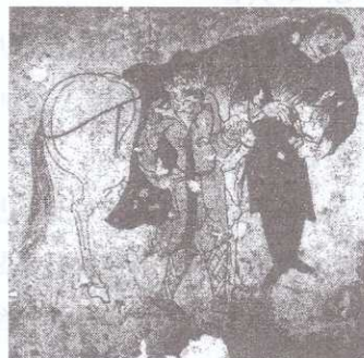
圖 1 唐太宗韋貴妃墓胡人牽馬圖